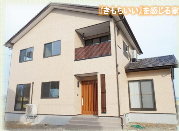
『きもちいい』を感じる家