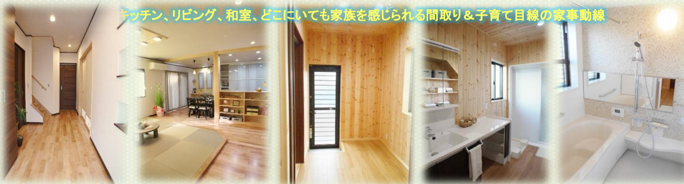
キッチン、リビング、和室、どこにいても家族を感じられる間取り&子育て目線の家事動線