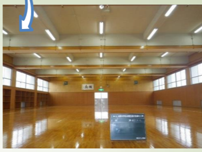
二階武道館(剣道) 工事後