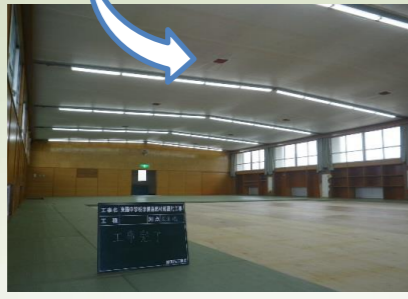
二階武道館(柔道) 工事後

照明器具やバスケットゴール・スピーカー等、地震で落下しないように取付け工事を施工