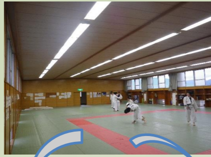
二階武道館 工事前

東日本大震災後、日本中のあちこちで頻りに地震が起きています。地域の学校や公民館は災害時の避難場所に指定され、その安全対策はとても重要！地震対策として、鯖江市役所などは構造体の耐震補強工事をしていました。東陽中学校の構造は耐震構造になっているので、地震の強い揺れで、高い天井や壁に取り付けてある物が落下し、怪我をしたり命を失う事の無いようにする工事でした。子供達の命を守る重要な工事ですね(^_^)