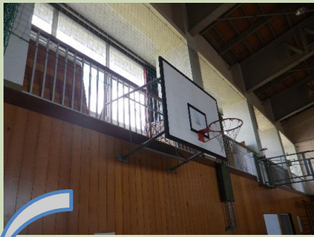
一階屋内運動場 工事前

昨年9月に完了した、東陽中学校の「非構造部材耐震化工事」について、どんな事をしたのかをお知らせします。