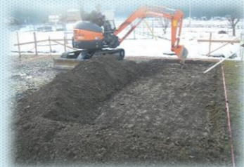
砕石を敷きつめて 地面を突き固める作業

先月、地鎮祭をした、イシンホーム鯖江店展示場ですが、いよいよ基礎工事が始まりました(^)/