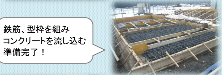
鉄筋、型枠を組み コンクリートを流し込む 準備完了！