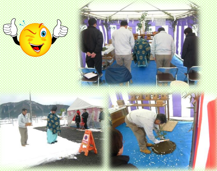
毎月、進捗状況をお知らせしますね😊

鯖江市下野田町にて... イシンホーム鯖江店展示場が3月完成予定です!! それに向けて、12月20日、地鎮祭が行われました。 『太陽光発電で楽々ローン』の家です。 皆様、完成を楽しみにお待ちしております(^▽^)