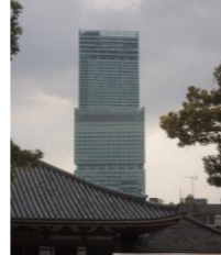
オープンホヤホヤのあべのハルカス