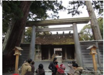
四月に解体される旧本殿の門

翌日は『LIXIL』のショールームでお勉強し、四天王寺境内からオープンしたばかりの『あべのハルカス』の姿を確認し